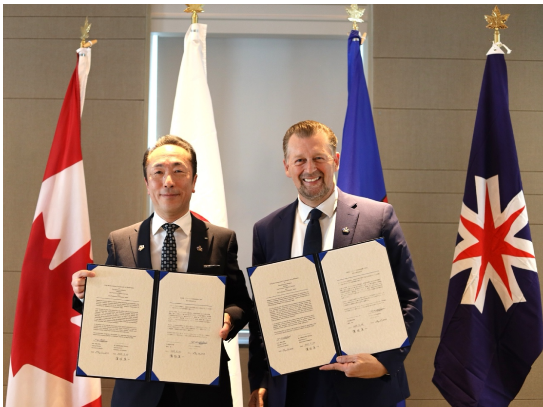
2025年5月22日、再確認式典後の浜坂副知事とエリス副首相